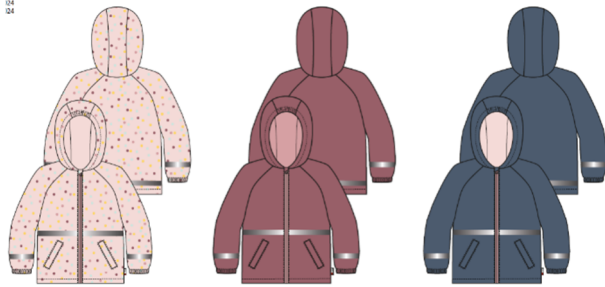
A AOP Light Rose