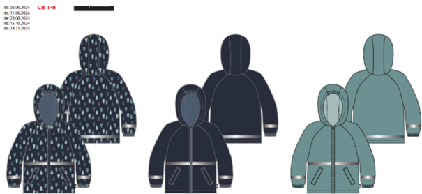
A AOP Navy