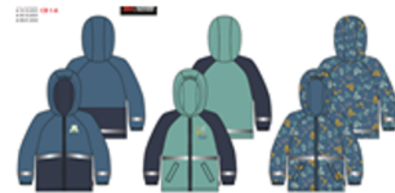
A Dark Blue Light Blue