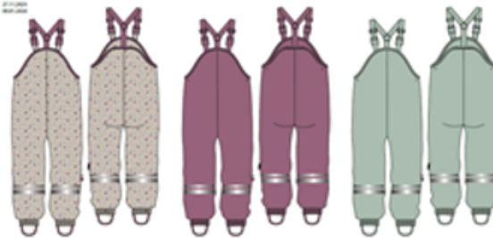
A AOP Beige