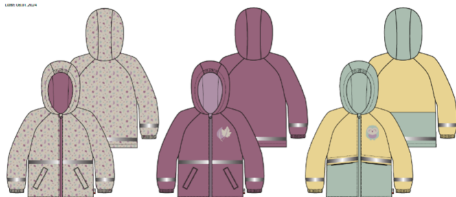
A AOP Beige